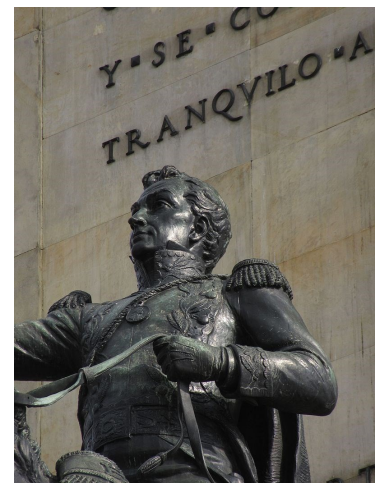
Detalle de la estatua ecuestre de Simón Bolívar.