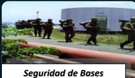
Seguridad de Bases e Infraestructuras