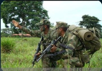
Control áreas consolidadas