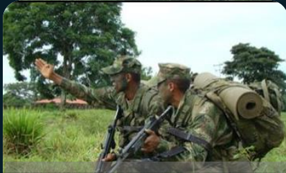
Operaciones Terrestres Sostenidas