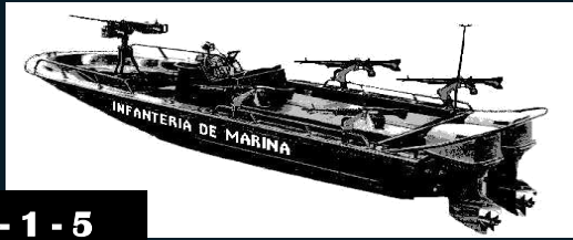
BOTE TACTICO 22'