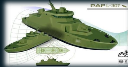
Patrulleras de Apoyo Fluvial Pesadas "PAFL" (14)