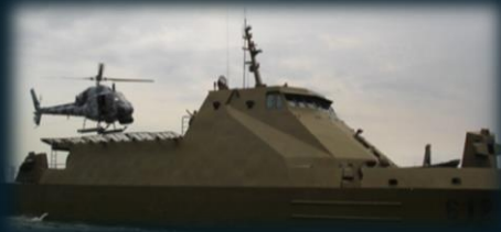
Patrulleras de Apoyo Fluvial Pesadas "PAFP" (08)