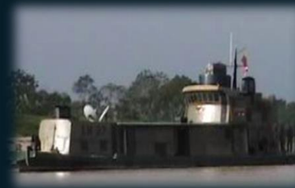
Remolcadores Fluviales "RF" (03)