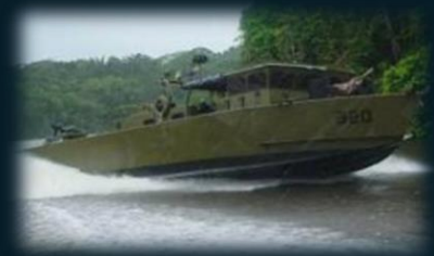
Lanchas Patrulleras de Rio "LPR" (03)