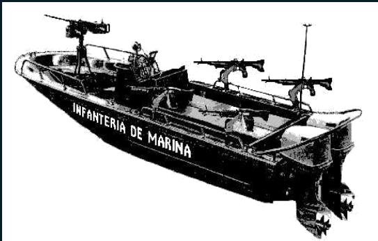
BOTE 26' COMANDO Y CONTROL