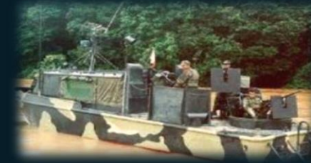
Patrullera Rápida Fluvial "PRF" (39)