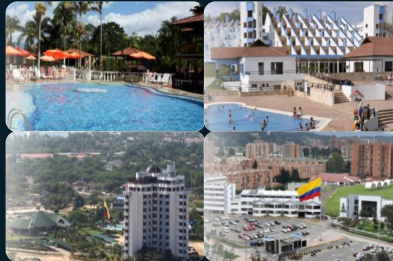
Moral y Bienestar