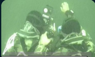
Operaciones de Comandos Submarinos