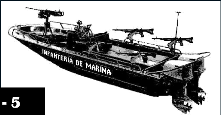
BOTE TACTICO 22'