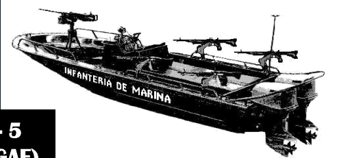
BOTE TACTICO 22'