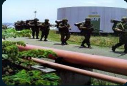
Seguridad de Bases e Infraestructuras