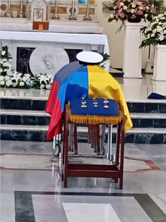
Acompañamiento en las honras fúnebres de 02 Oficiales de I.M.