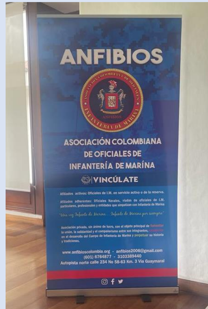
Elaboración del pendón