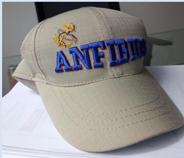
Entrega de la Gorra ANFIBIOS